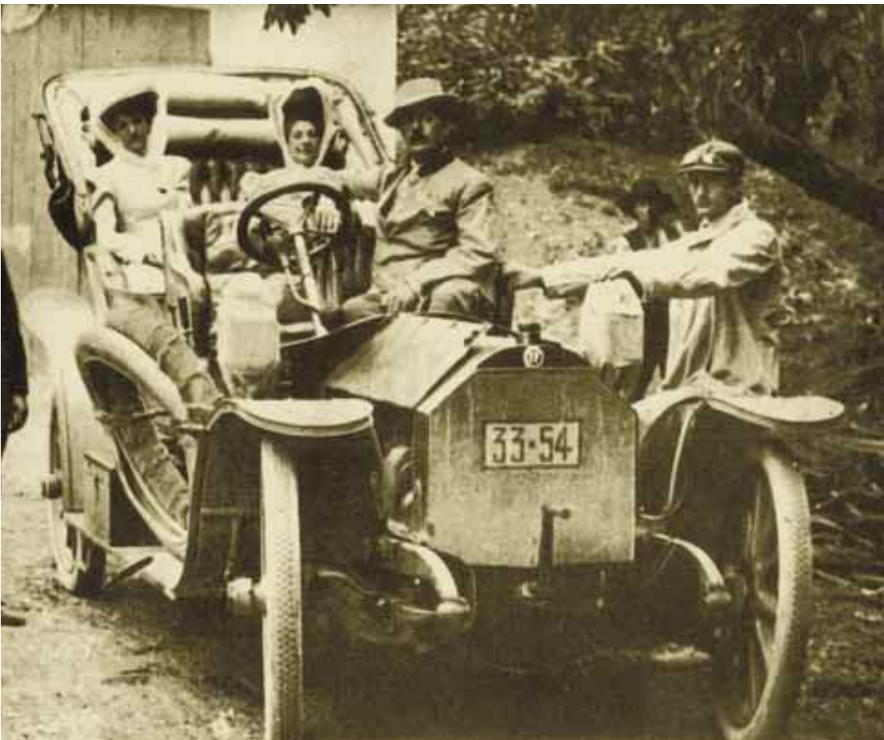
Puccini en la estancia "El Dorado" de Benito Villanueva / Vedia, provincia de Buenos Aires, 1905.

El 24 de abril de 1890, Giacomo Puccini envía una carta a su hermano Michele en los siguientes términos: "No sé si iré al campo, ya que estoy en la ruina. Si te va bien allí donde estás, yo también iría, en caso de haber trabajo para mí. Escríbeme a este respecto. Estoy cansado de esta eterna lucha con la pobreza". El 3 de abril, escribe otra misiva en la que, entre otras cosas, dice: "...Si pudiese hallar maneras de ganar dinero, iría adonde estás. ¿Hay alguna posibilidad para mí allá? Abandonaría todo e iría. Escríbeme con frecuencia y cuéntame todo lo que haces... Anoche trabajé hasta las tres de la madrugada, y luego cené un manojito de cebollas... Ten cuidado y vive lo más aho-